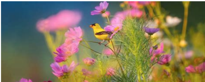
Temps de la Création – Eglise verte ( https://eglisesvertes.ca/wp-content/uploads/2018/05/ )

de notre compréhension. Il faut faire confiance et se laisser guider vers un monde meilleur à venir. Ce monde est appelé « Royaume de Dieu » dans les paroles de Jésus. Il est souvent illustré à travers des récits imagés, les paraboles, qui insistent sur la nécessité d'une vie matérielle frugale mais une vie riche en spiritualité et en liens entre les humains. Cela est résumé par la formule de Jésus « Faites donc du Royaume de Dieu et de ce qui est juste à ses yeux votre préoccupation première, et toutes ces choses vous seront données en plus. Ne vous inquiétez pas pour le lendemain ; le lendemain se souciera de lui-même ».